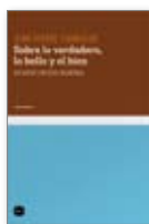
CHANGEUX, Jean-Pierre Sobre lo verdadero, lo bello y el bien (Katz)

Lejos de la imagen típica del inventor que revoluciona el mundo con su creatividad desbordada, el autor del presente título aboga por presentar una visión evolutiva para entender la historia de la técnica. Así, y al igual que en los seres vivos, en cada momento habría una variedad de opciones para resolver un determinado problema técnico y la sociedad escogerías unas u otras en función de criterios económicos y culturales. Este proceso sería gradual y partiendo de la tecnología ya presente.