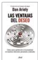
ARIELY, Dan Las ventajas del deseo (Ariel)

En un título anterior, el psicólogo y economista Dan Ariely abordaba los impulsos que nos llevan a tomar decisiones insensatas. En el presente volumen vuelve a la carga sobre la cuestión de la irracionalidad, pero destacando los efectos positivos que puede suponer para nuestra vida diaria, tanto en el ámbito personal como en el laboral. El autor, que fue soldado en Israel y estudió física y matemáticas en Tel Aviv, echa mano de numerosos análisis y experimentos para extraer conclusiones sobre el cómo y el por qué nos comportamos del modo en que lo hacemos. El libro también proporciona algunas respuestas para tratar de comportarnos mejor tanto para nosotros mismos como para el resto de la sociedad.