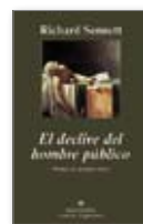
SENNETT, Richard El declive del hombre público (Anagrama)