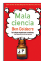
GOLDACRE, Ben Mala ciencia (Paidós)

Desde los albores de la civilización, los humanos hemos diseñado juegos, como el ajedrez, el dominó o los naipes, en los que intervienen el azar, la estrategia, la reflexión, las paradojas y los dilemas. Y el hecho es que todas estas cuestiones tienen una clara conexión con el universo de las matemáticas. El autor del presente título nos invita a un viaje apasionante sobre la relación entre las matemáticas y los juegos a lo largo de la historia. Una relación que se hizo más estrecha a partir de mediados del siglo pasado, cuando en plena Guerra Fría se desarrolla la moderna teoría de juegos, cuyo principal objetivo es el análisis de estrategias ganadoras a la hora de abordar cualquier tipo de conflicto.