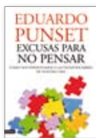
PUNSET, Eduard Excusas para no pensar (Destino)