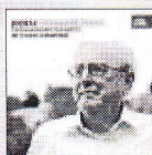
Poemas sinfónicos SUPRAPHON, DDD. UNCD.

1 Orquesta Filarmónica Checa. Director, Sir Charles Mackerras. 1 He aquí un disco con cuatro de los cinco poemas sinfónicos que escribió Dvorak entre los años 1896 y 1897. Es lástima que las dimensiones de duración del disco no hayan permitido grabar también el postre: El canto de los héroes , porque la versión de Charles Mackerras es excepcional, contando además con el concurso de una orquesta totalmente afín con la obra del compositor como es la Filarmónica Checa, de la que el maestro neoyorkino era principal director invitado. La agrupación sinfónica que pasó malos momentos con posterioridad a la caída del muro de Berlín, en la década de los noventa del pasado siglo, se rehizo con el cambio de siglo, volviendo a tener el excepcional nivel del que siempre había disfrutado en los tiempos de Ancelri o Nevmann . Este registro que comentamos es buena prueba de ello. Mckerras que es un director refinado donde los haya (buena prueba de ello son sus elogiadas versiones de música barroca y clásica) logra frente a unas muy esmeradas calidades sonoras al conjunto orquestal, una suntuosa opulencia de animado aliento y también una imperativa precisión del relato, entendiendo muy bien los muy diversos postulados descriptivistas de las partituras. Precisión, carácter y convicción.