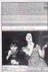
«L'elisir d'amore». DECCA DDD. UN DVD.