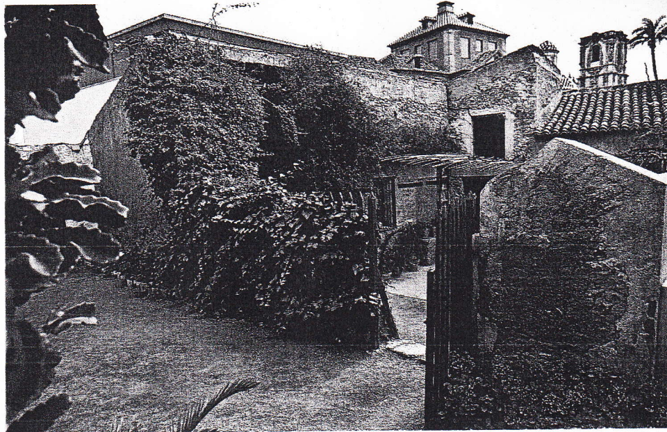
CASA EN ORIHUELA. MIGUEL HERNÁNDEZ En la casa situada en el número 73 de la calle de Arriba, en Orihuela, creció Miguel Hernández, hasta que se mudó a Madrid en 1934. La residencia, actualmente Casa Museo del poeta, aún conserva el jardín, el pozo, el granero y el huerto que inspiraron sus primeros versos. "Mi carne, contra el tronco, se apodera / en la siesta del día, / de la vida, / del peso de la higuera".

La actualidad bien contada. Estos libros, bajo el epígrafe de 'Periodismo', abordan cuestiones de interés general con escrituras particulares, las de sus autores, que aportan a su conocimiento del tema sus visiones personales