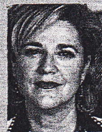
Pilar Rahola La república islámica de España / La República Islàmica d'Espanya