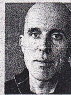
Christopher McDougall Nacidos para correr