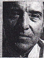
Iñaki Gabilondo El fin de una época