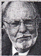
Mauricio Wiesenthal Gran diccionario del vino

La sociedad occidental y su cultura no pueden desligarse del cultivo de la vid y de su producto más esencial, el vino. El autor de Libro de réquiems vuelca aquí su doble sabiduría vinícola y humanística, en un diccionario que recoge 6.500 entradas, 2.500 voces de léxico especializado y más de 5.000 artículos con información enciclopédica actualizada. La obra refleja panorámicamente cómo ha ido evolucionando la cultura del vino, desde los benedictinos a los poetas árabes, y de los trova-