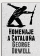
GEORGE ORWELL Homenaje a Cataluña DEBATE, ENSAYO, 2011

► Uno de los libros más importantes del XX, admirado por autores de toda época y condición, desde Connolly hasta Cercas , Beevor o Vargas Llosa , que llegó en los años sesenta a Barcelona con esta obra bajo el brazo. Un texto clave sobre la guerra de España, que sirvió de ensayo general a la Segunda Guerra Mundial, y que recoge la experiencia personal de Orwell . El británico llegó en diciembre de 1936 a una Barcelona en efervescencia revolucionaria y en menos de un año tuvo que huir de la maquinaria soviética por haber formado parte de las milicias del POUM. Poderoso manifiesto por el hombre y contra las abstracciones que acaban conduciendo al terror.