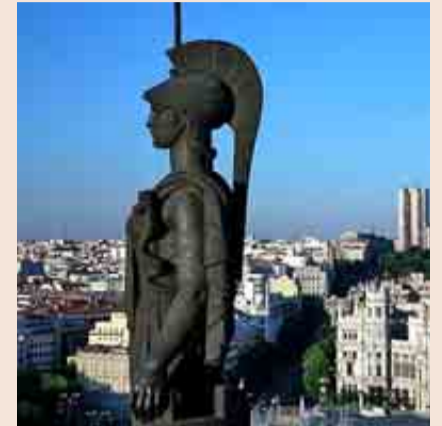
El Círculo de Bellas Artes ha preparado una programación navideña para los niños.