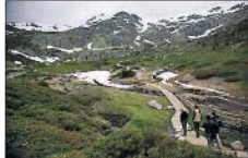
Parque Nacional del Guadarrama.

Las cumbres de la Monja y el Peñotillo fueron retratadas por Diego Velázquez en El príncipe Baltasar Carlos a caballo . Estos mismos paisajes estarán en la ruta histórica de Senderismo Madrid por lugares de la sierra de