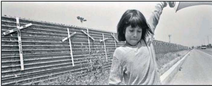
Imagen captada en Tijuana en 2006, en la frontera entre Estados Unidos y México.

Los escritores mexicanos del siglo XXI no forman una generación ni una facción ni un movimiento. Son un grupo de voces individuales, del que este reportaje solo recoge algunas, enfrentadas a una realidad mucho más amplia que la del narco en el que las cosas están dejando de ser lo que eran. Como dice Monge: "Lo único común entre los escritores mexicanos contemporáneos es que todos somos cazadores y que son tantas las bestias y es tan grande el paraje que no tenemos que encontrarnos ni compartir presas ni armas". ●