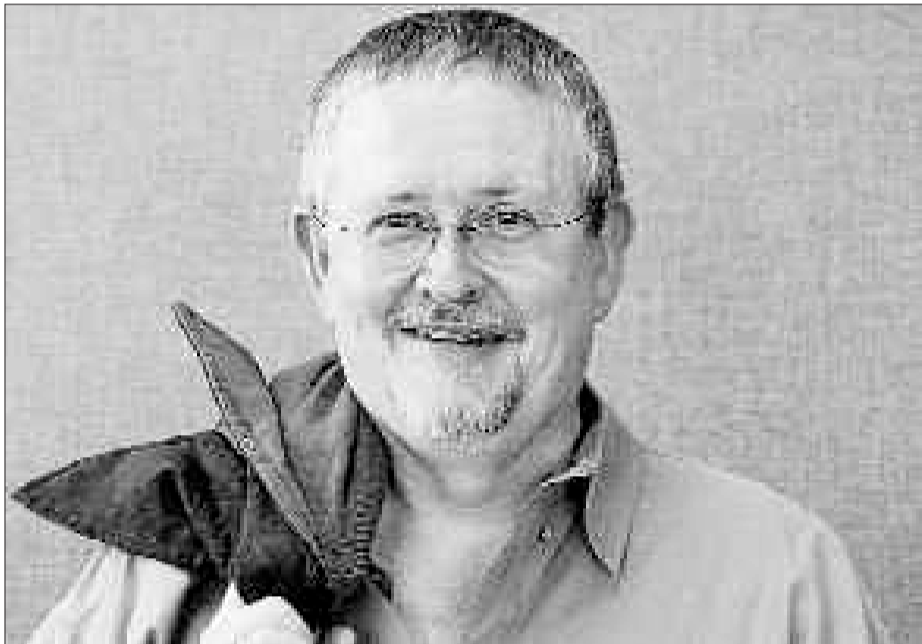
El escritor Orson Scott Card, en una imagen del año 2008.