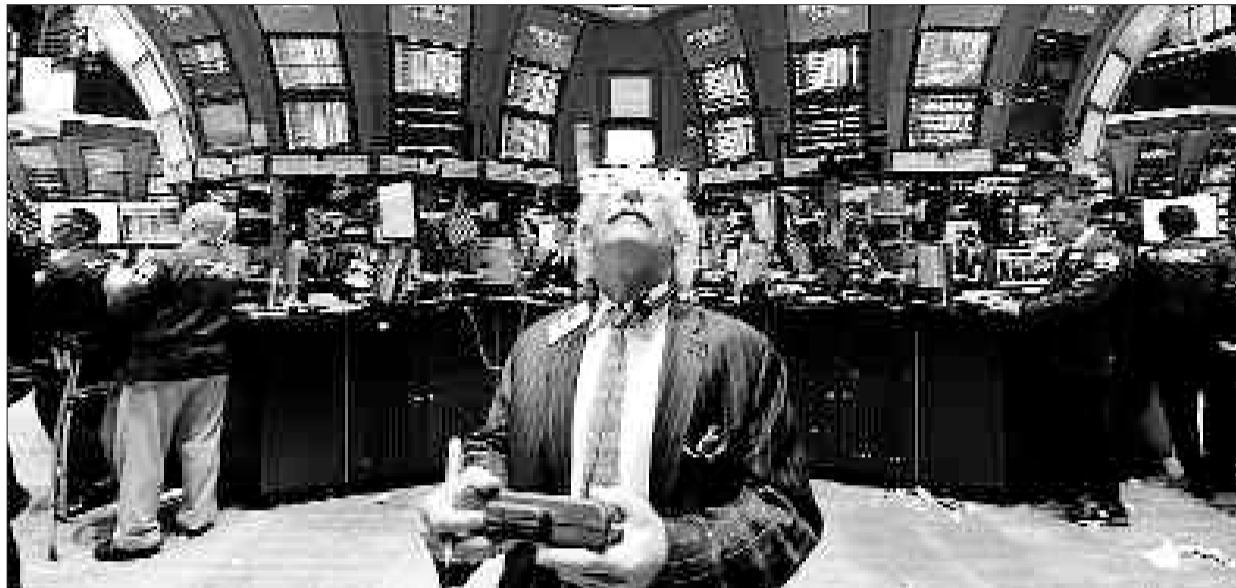
Un corredor de bolsa mira los paneles en Wall Street.

► «Fue un regalo que me hice en los Reyes, mientras me encontraba buscando otros para la familia. Sobre todo nos habla de diversos aspectos, que tal como refleja el título, nos influyen para generarnos el sufrimiento. Ayuda a que nos los planteemos de otra forma y así poder evitar que nos surjan más problemas»