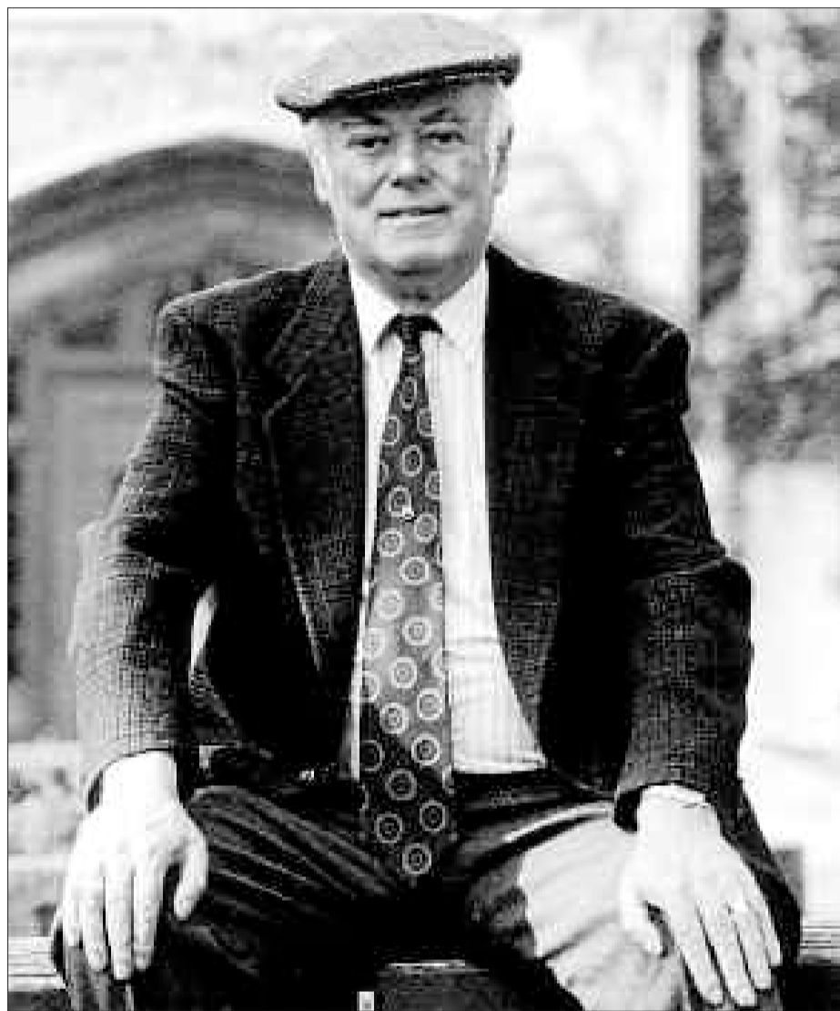
Alistair MacLeod, con su inseparable boina, en una imagen de archivo.

ocupa de dos de ellos, se percibe el ciclón de una prosa frenéticamente honesta y melancólica; una capa de autenticidad que, sin embargo, no oculta el perfil y las habilidades de coloso de Alistair MacLeod, un escritor monumental, con apenas un ramillete de cuentos y una novela publicadas y una etiqueta de autor de culto adherida a cada una de sus palabras desde que apareció su primer texto en Estados Unidos. El autor de Isla escribe sobre la mina y la pesca y el campo y los abuelos y en eso simplemente está todo. Es como si empeñara en demostrar, en esta época, en el momento el que abundan los giros de los giros y las colmenas metaliterarias, que, en realidad, los temas son los mismos de siempre; déme una pistola y una chica y contaré una historia, escribió Godard y MacLeod parece decir lo mismo, aunque con una montaña y un perro y un poco de niebla y, so-