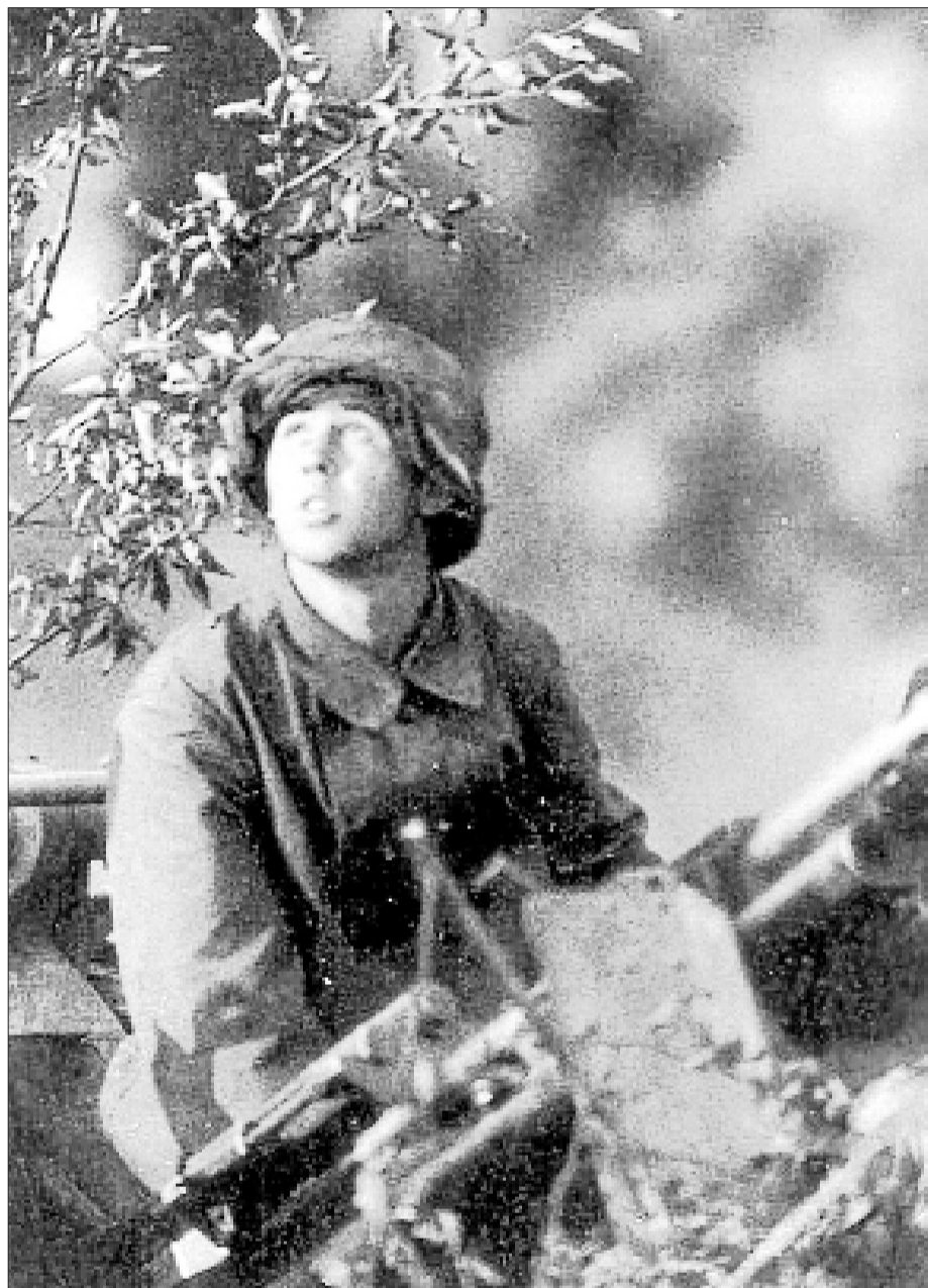
Joven artillero alemán en Normandía en los días posteriores al Día D.

El Gregor de la vejez, amigo de las palomas, no dista nada del creador que soñaba con un mundo encendido al anochecer y que se nutría de electricidad gratuita. En el fondo, esta novela sobre el poder de los sueños frente al poder económico es un relato poderoso que ensalza, por encima de las decepciones que acompañaron al auténtico Testa, la bondad humana.