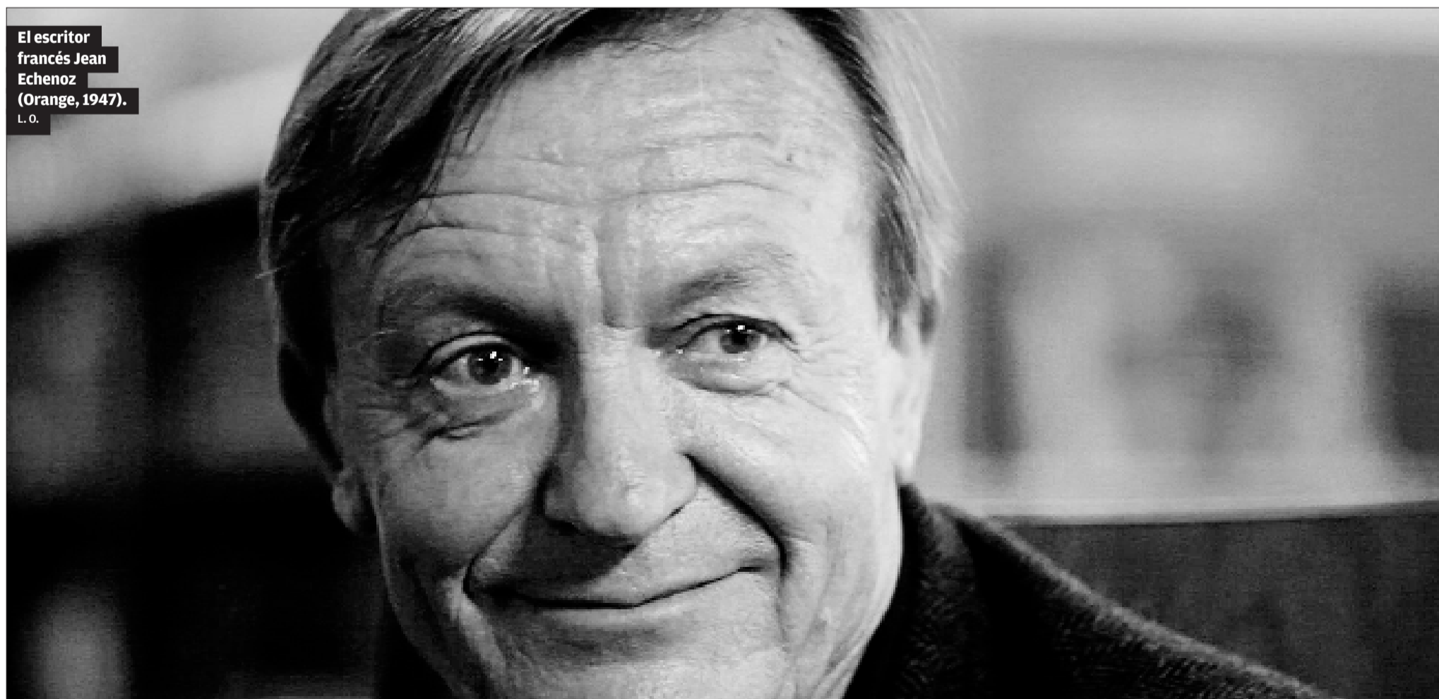
El escritor francés Jean Echenoz ( Orange , 1947). L. O.

En la única parte de la novela en la que Echenoz se muestra menos ahorrativo, menos pulido, es a la hora de hablar de las palomas, la pasión de la vejez de Gregor, que se vuelca en estas aves a medida que la sociedad y los medios de comunicación, antes tan presentes en su vida, le dan la espalda. El autor francés se detiene con delectación y algo de horror en la atracción del inventor centroeuropeo por estos pájaros que algunos, nada metafóricamente, llaman «ratas del aire», unas aves que